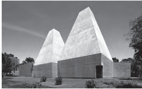
Figura 3 – Casa das Histórias Paula Rego

5. A Casa das Histórias Paula Rego é um museu de arte localizado em Cascais.