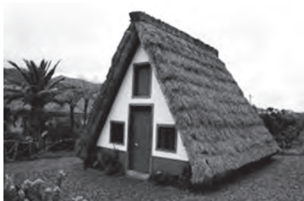
Figura 1 – Casa típica de Santana

No esquema, os segmentos de reta [AC] e [BC] representam o telhado da casa.